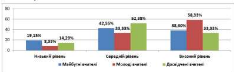
Рис. 3. Відсотковий розподіл педагогічних працівників різних вікових категорій за критерієм готовності викладати учням матеріал про глобальні світові зміни.

Відсотковий розподіл педагогічних працівників за критерієм готовності викладати учням глобальні світові зміни, говорити з ними о причинах війни, нагальних проблемах, відповідати на складні запитання відображено на Рис. 3.