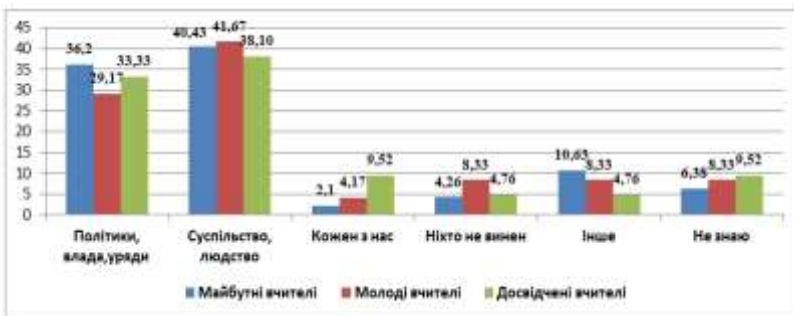
Рис. 4. Порівняльний відсотковий розподіл відповідей педагогів різних вікових категорій.

5. На запитання «Хто винний у виникненні війн та різноманітних криз» думки педагогів поділилися (рис. 4). 32,9% опитаних перекладає відповідальність на політиків та владу, а 40,4% вчителів вважають, що винне в цьому все людство. Це також відповідає провідній ролі соціальних і політичних чинників. 3,8% вчителів відчувають особисту відповідальність за те що відбувається у світі, що свідчить про високий рівень розвитку їх громадянської свідомості, а 5,8% вчителів вважають, що в цьому ніхто не винен, адже війни та кризи, з погляду на історію людства, є циклічним явищем.